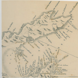
112 TOPONIMS I DATES HISTÒRIQUES A LA BARRA DE POLLENÇA, AFUJATS AL MAPA DEL CANONGE DESPUIG. Cal observar la col·locació de la toponímia literària.

En escriure fem un acte de cultura de comunicació, sobre tot en un mapa, assolint el adequar els ritms a la realitat en pocs mots, que l'usuari trobi al terreny allò que cerca o que el propietari vegi reflectit sobre el paper la seva possessió. Tanmateix, ara i sempre, pot haver-hi un divot acorreat entre parla i escriptura, fundat en normes o prejudicis. La gent culta mallorquina de la segona meitat del segle XVIII que pertanyia al cercle il·lustrat d'allò que s'ha anomenat Decadència – veu se situaven els col·laboradors de Despuig i el nostre anònim escriptura «liberalitzant», era conscient de l'oportunitat d'una normativa ortogràfica. N'és prova que el comte d'Alcamaz, un dels més conspicuos integrants d'aquell còndic, va redactar als volts de fi de segle una Ortografia ara no localitzada. Deia seguir camins semblants als de la