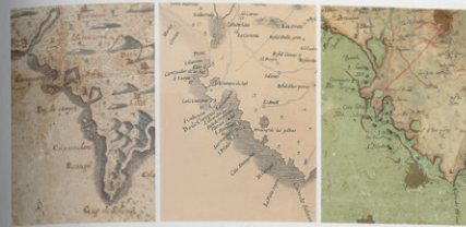
LANDAETA DESPUIG ANÓNIM

De tots els mapes estudiats aquí, només n'hi ha alguns que mostrin una zona d'aiguamolls al lloc de l'illa. Mentre que de de l'est, Toldrà López (1793) i Massot considerem només ses Fontanelles—anomenada per Massot Ataly de l'Arinat que correspon al Prat de Sant Jordi—, Despuig i l'anònim, igual que Espinall i López (1773 i 1788), representen un total de quatre zones. La primera es Prat i la resta, de nord a sud, les Salines de Llevant a ponent de la font Santa—al mapa anònim separades de la mar per una restinga sense gaire—, l'Estreque de Sant (els Estany) i l'Estang de les Gibes (l'estany de ses Gambes). Aquests espais ambfíls els podem trobar ja al mapa del MM. A prop de La Porrana Despuig presenta un aiguamoll prop circular sense línia de contour mentre que al mapa anònim apareix gairebé rodó i clarament limitat, àrea que correspon avui al salobrar de Magaluf. Tant al mapa de Despuig com a l'anònim es distingeixen també les salines dels aiguamolls, com s'observa al Estreque de Sant . L'àrea salina al primer mapa es simbolitza mitjançant un creuat de línies diagonals per indicar la subdivisió en bases d'exploració; al segon es visualitza a través d'una estructura arribada d'un to verdós més clar que els altres i la mar.