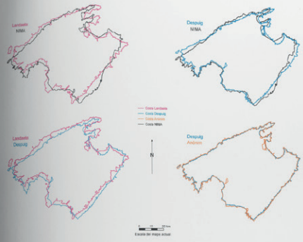
S.I. CONFIGURACIÓ DE L'ILLA DE MALLORCA Comparació de la costa dels tres mapes estudiats amb l'actual de la NIMA. Escala aproximada: 1:1.000.000.