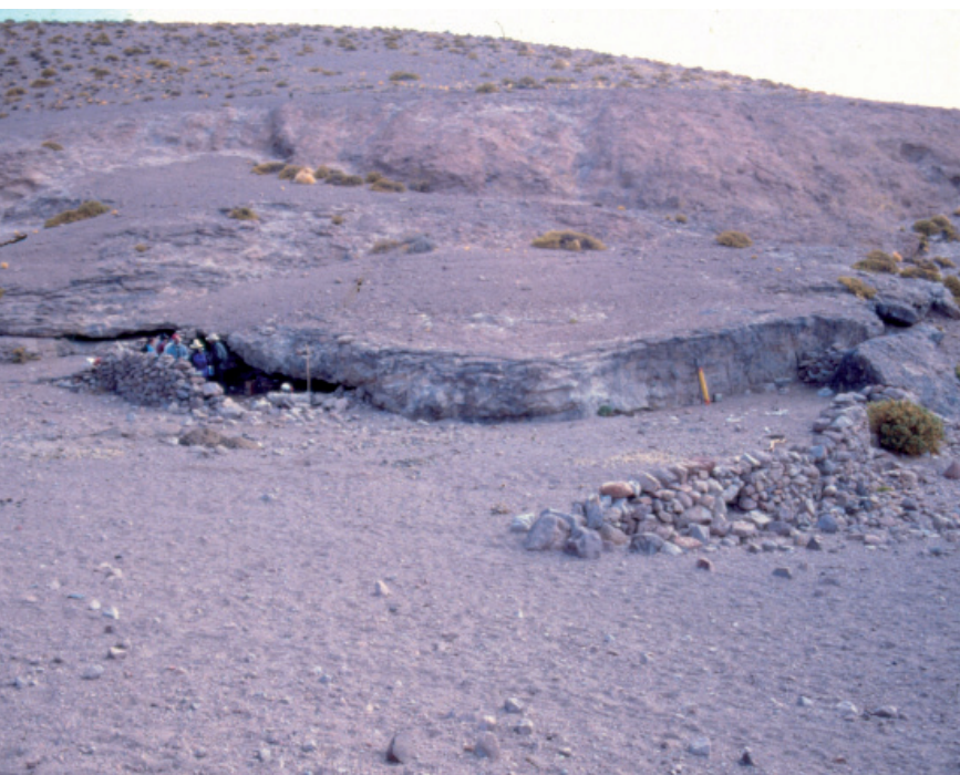
Figura 6. Alero RG6

curso medio-superior del río Las Pitás (Fig. 6), una zona que pese a su altitud posee abundantes recursos hídricos y pasturas durante todo el año que resultan ideales para el pastoreo de invernada complementándolo con el pajonal de altura (Olivera y Elkin 1994). Los fechados disponibles ubican las ocupaciones humanas en RG6 entre c. 1200 y 700 AP (Olivera 1991), coincidiendo con los momentos más tardíos de CChM.