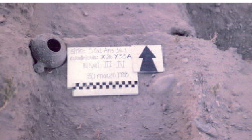
Figura 5. Vista general y representaciones rupestres en CC1A.