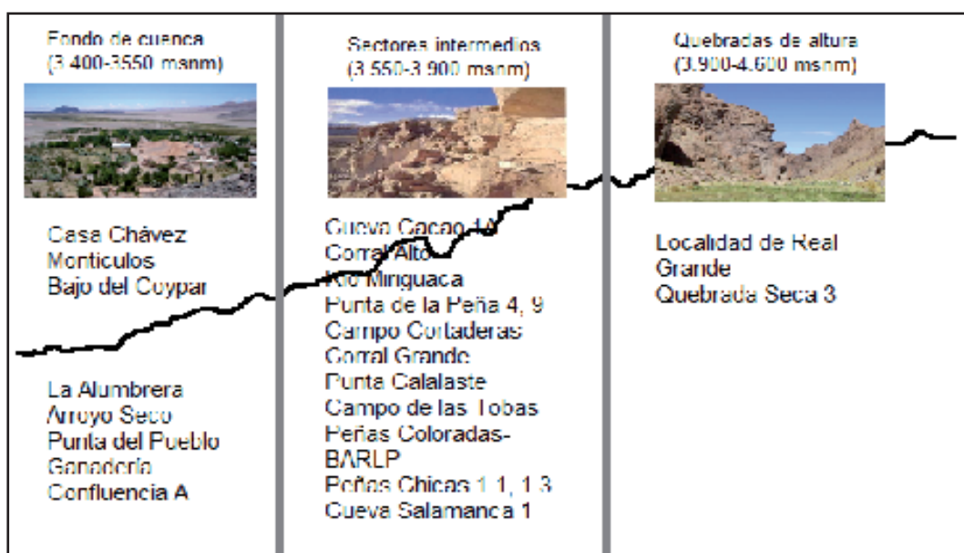
Figura 2. Ubicación de los sitios mencionados en el texto en las diferentes áreas altitudinales.

Dentro de localidad de Antofagasta de la Sierra y a fines analíticos se han señalado tres sectores microambientales (Fig. 2) con alta concentración de recursos (Olivera 1991, 2001), cuyas diferencias topográficas y de recursos estuvieron estrechamente vinculadas a la estructura y dinámica de las poblaciones locales (Olivera y Podestá 1993; Olivera y Elkin 1994; Escola 2004):