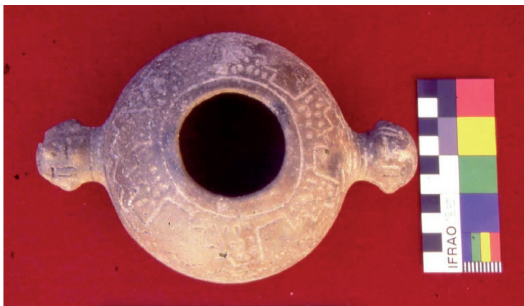
Figura 9. Vasija completa recuperada en CChM1, Componente Superior (finales del Formativo) de filiación valliserrana.

El material decorado no es demasiado abundante en los sitios formativos de Antofagasta de la Sierra pero constituye una fuente de información importante para postular relaciones entre esta zona de la Puna y las áreas cercanas (Fig. 9). La muestra proveniente de CChM no fue objeto de este análisis pero ha sido previamente estudiada por Olivera (1991, 1997), quien propuso una serie