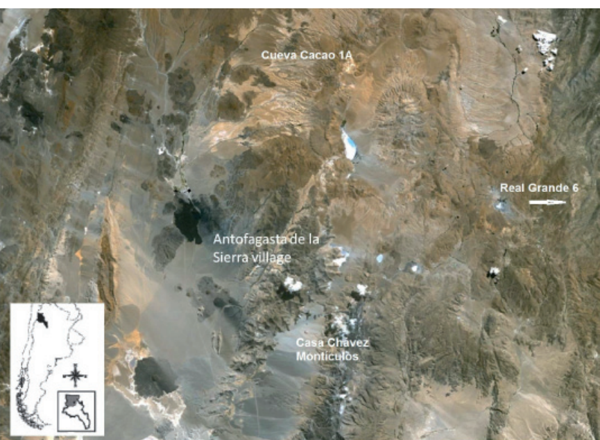
Figura 1. Topografía de la región de Antofagasta de la Sierra y sitios estudiados en este trabajo.

La cuenca del río Punilla constituye la red hidrográfica más importante de la zona, alimentada por varios manantiales que se originan en la base de los cerros Mojones y Galán. Entre sus principales tributarios destacan los ríos Ilanco, Las Pitás, Miriguaca, Mojones, Los Colorados, Toconquis y el arroyo de Curuto, a la vera de los cuales se han localizado numerosos sitios arqueológicos (Olivera et al. 2004).