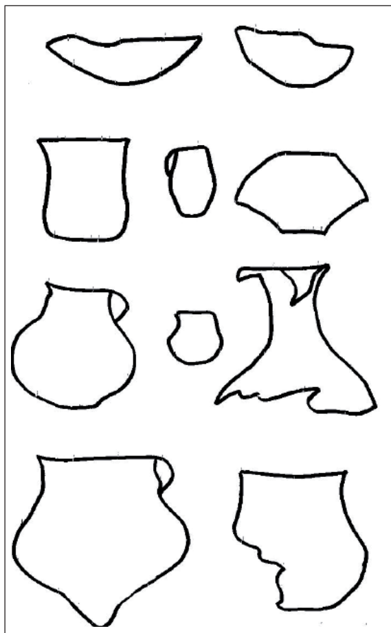
Figura 7. Morfología de la cerámica de Antofagasta de la Sierra (según Ambrosetti 1904).

representación tanto entre los distintos sitios como a lo largo de la ocupación de CChM, con una acusada reducción en cantidad en los niveles más recientes. En el caso de RG6, la presencia de estos