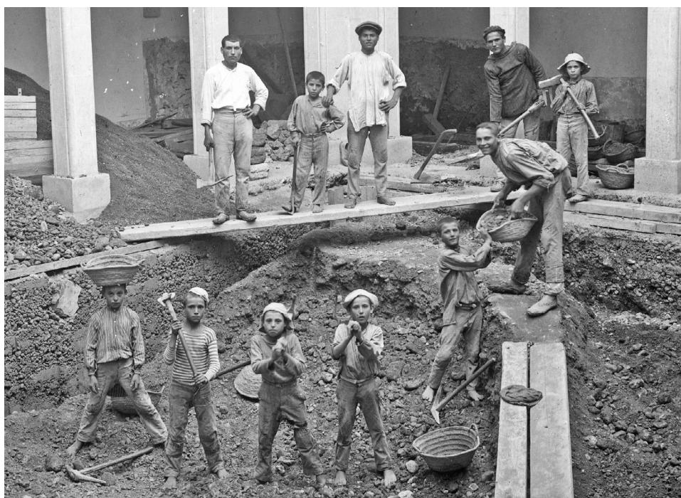
Figura 2. Obres a la Casa d'Exercicis de Sa Pobla, Fons Antoni Palou, Arxiu Històric de la UIB.